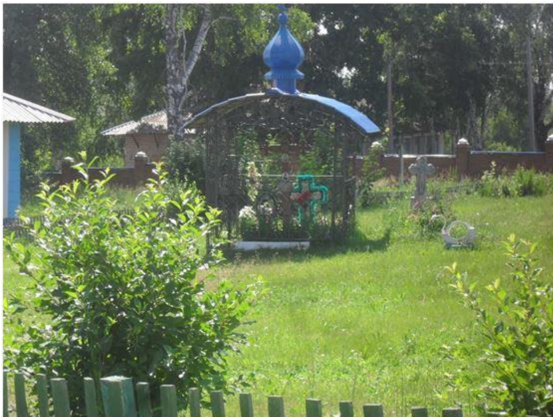
Крестный ход иконы Зосимы Эннатской к святому источнику